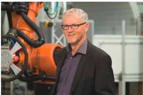
Autor: Dr. Matthias Umbreit, Fachreferent Robotik im Fachbereich Holz und Metall der DGUV, Berufsgenossenschaft Holz und Metall